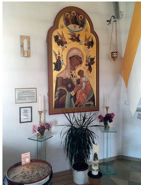
Ikone der Schutzpatronin der Kirche

Ganz besonders stolz bin ich darauf, dass ich sehr nahe bei den Schammelsdorfern, in der Dorfmitte, erbaut worden bin, also immer im Blickwinkel stehe. An mir kommt man in Schammelsdorf einfach nicht vorbei. Ich freue mich, wenn ich Besucher habe, sei es zu den Gottesdiensten am Donnerstagabend, zu Taufen, Rosenkränzen und Maiandachten, ja sogar zu Hochzeiten oder einfach nur zur persönlichen Zwiesprache mit unserm Herrn in der Stille des Kirchenraums.