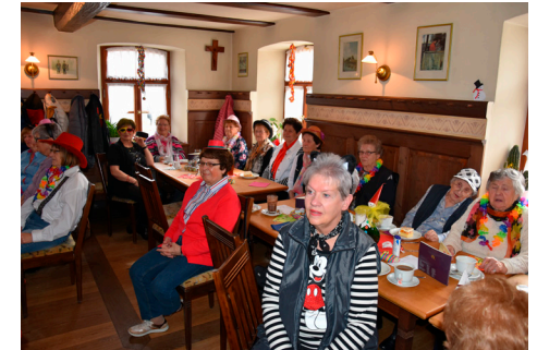
Seniorenfasching 2019.

So und mit noch verschiedenen anderen kleinen, aber gezielten Aktionen kümmert sich die Pfarrei Geisfeld um