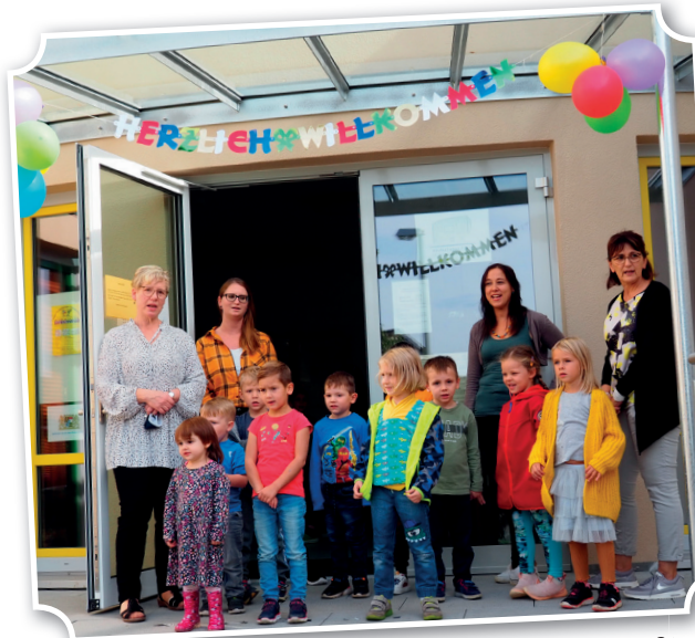
Mit einem Lied wurden die geladenen Gäste begrüßt.

Am 2. Oktober 2020 wurde die sanierte und erweiterte Kita in einem Corona-bedingten kleinen Kreis geladener Gäste aus Politik und Kirche offiziell eingeweiht. Wir hoffen sehr, im nächsten Jahr einen Tag der offenen Tür für alle Interessierten nachholen zu können. Autorin: Petra Schwantes.