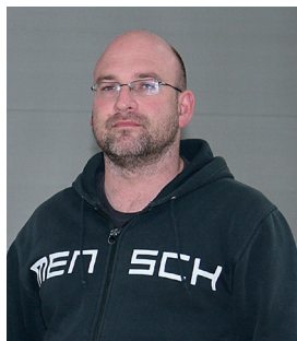
Autor und Bild: Andreas Bär, Pastoralreferent, JVA Nürnberg

Indem sich Seelsorge „an die Ränder der Gesellschaft“ (Kranke, Inhaftierte, Obdachlose, Verarmte, ...) bewegt, wird sie dem Grundauftrag Jesu gerecht und trägt gleichzeitig dazu bei, dass gesellschaftlich ein Auffangnetz gesponnen wird. Wer heute inhaftiert war, ist morgen wieder unser Nachbar!