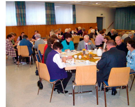
Seniorenachmittag 2010.

Einmal im Jahr sind dann alle zum großen Seniorenachmittag in den Pfarrsaal eingeladen. Bei Kaffee und Kuchen, einem kleinen Unterhaltungsprogramm und einem gemeinsamen Abendessen besteht die Möglichkeit zum regen Austausch, zum Plaudern mit seit längerem nicht mehr gesehnen Altersgenossinnen und -genossen und einfach zum Gucken und Hören.