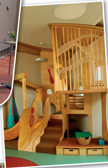
Die Krippen-Spielebene lädt zum Erkunden, Ausruhen und Verstecken ein.