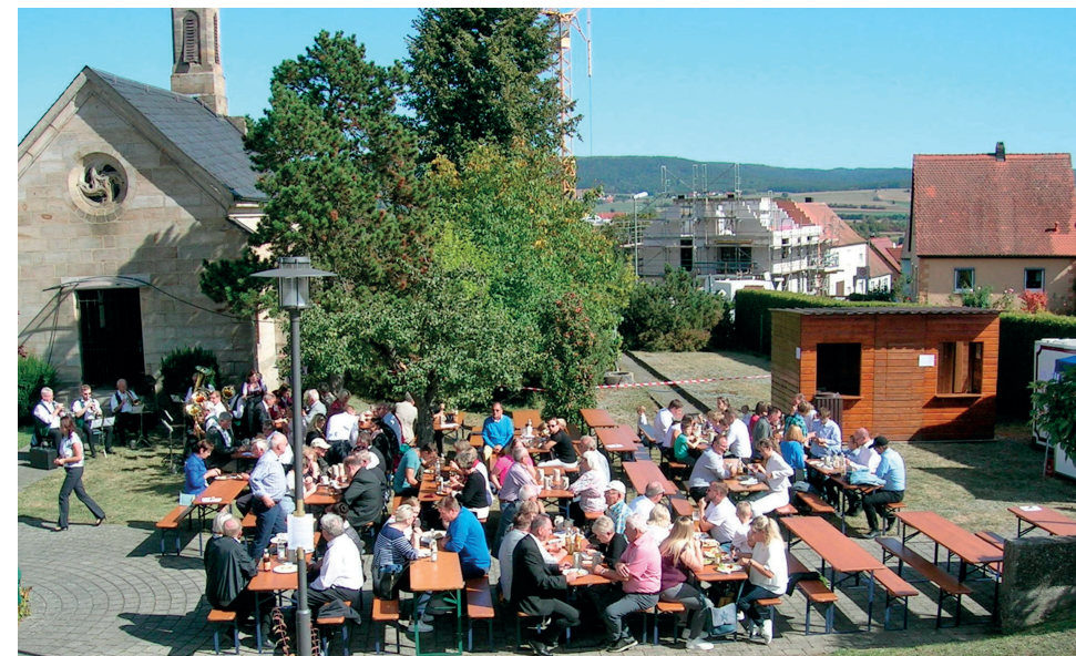
Pfarrfest im September 2019.

mit den Filialen Maria vom Berge Karmel Erlach und St. Vitus Röbersdorf