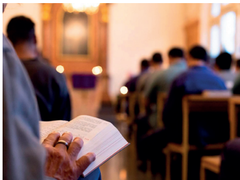
Gottesdienst mit Erzbischof am 18.12.2018 in der JVA Nürnberg.

mich ein Großteil von Lebensgeschichten von Menschen heraus, die „größer sein“ wollten. Dazu zählen alle Versuche im sozialen Ranking durch eine Abkürzung oder Hintertür (Diebstahl, Raub, Betrug, Erpressung, ...). „Größer sein“ wollen kann aber auch die Unzufriedenheit mit sich selbst bedeuten. Dann kann das Überspielen von vermeintlichen Schwächen der Hintergrund sein (Betäubungsmitteln, Suchstoffe, etc.).