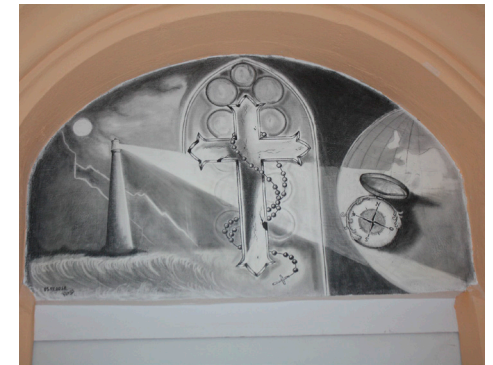
JVA Nürnberg – Zeichnung eines Häftlings an Eingangstür des Autors.

Die Gefängnisseelsorge im Justizvollzug gehört nicht zum „Pflichtpro-