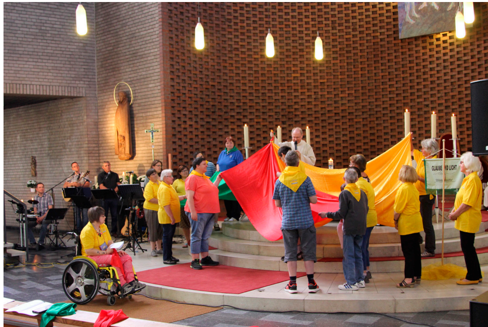
Der Gottesdienst zum 20jährigen Jubiläum unserer „Glaube und Licht“-Gruppe in Forchheim

Ich möchte hier einen Ort vorstellen, an dem geistig Behinderte im Mittelpunkt stehen: