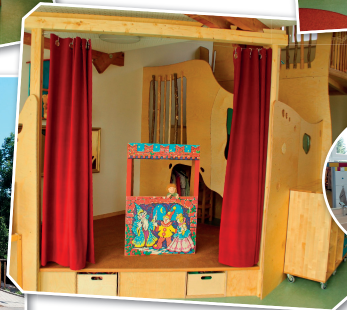
Vorhang auf, wir spielen Theater!