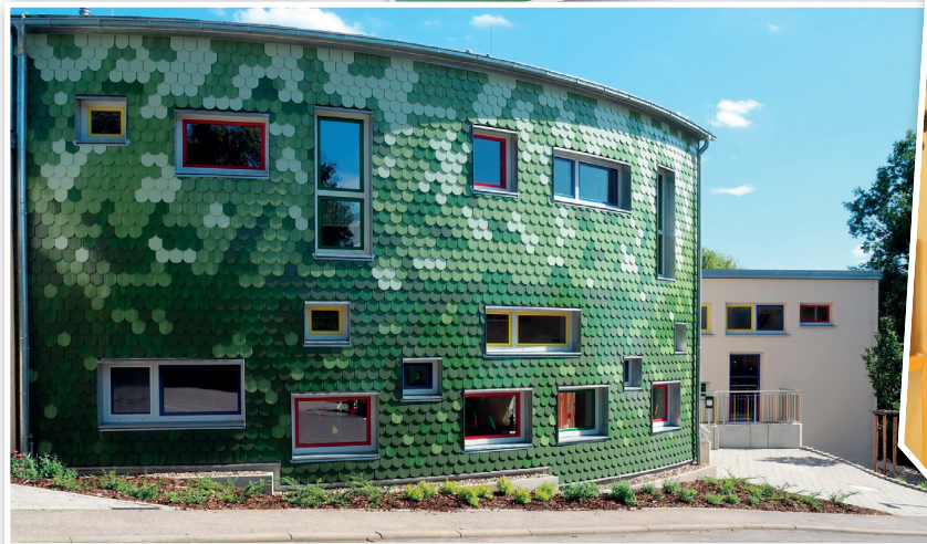
Eine interessante und freundliche Fassade.