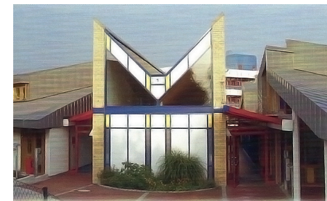
Hospiz Bamberg.