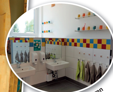
Jede Gruppe hat ihren eigenen Waschraum.