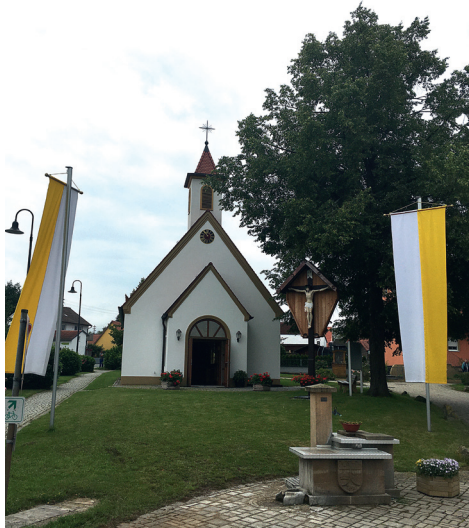
Schammelsdorfer Dorfkirche – Außensicht